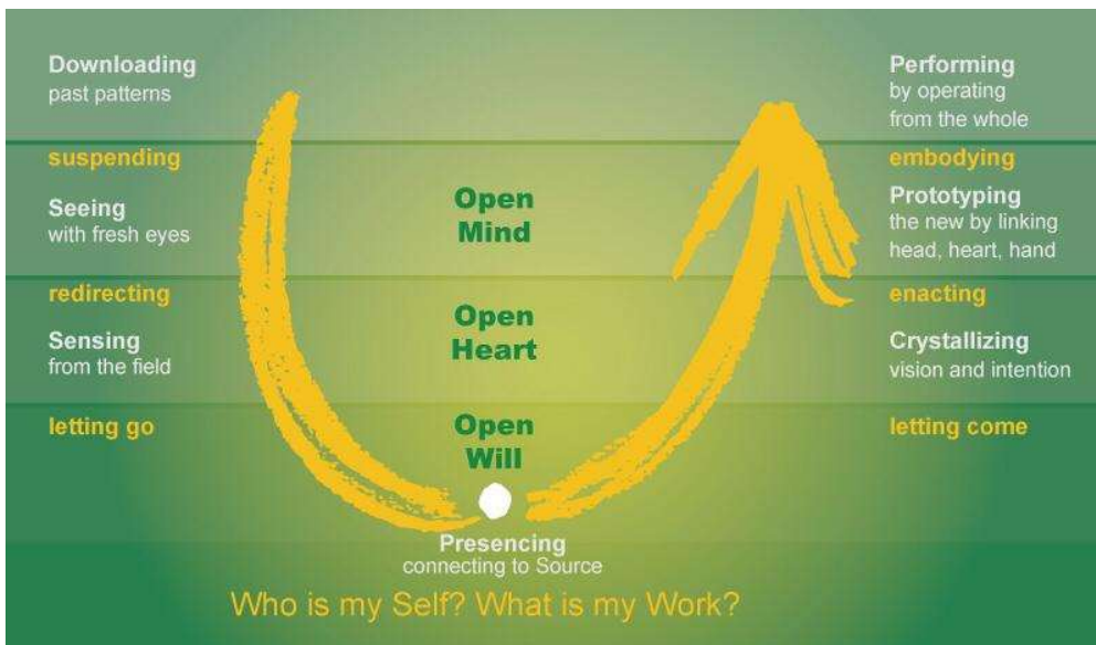
Tabel 1: Fasen van 'de innovatie-reis' volgens Theory-U

Het succes van dit project en de mate van innovatie zal afhangen van de kwaliteit van het programma en de kwaliteit van de deelnemers. Het eerste aspect hebben de aanvragers zelf in de hand en zij zijn vol vertrouwen dat dit gaat lukken gezien de ruime mate van ervaring met participatieve groepsprocessen. Het tweede aspect hebben de aanvragers niet zelf in de hand. Gezien de ervaringen met het netwerk en samenwerkingsverband FoodDelta Zeeland achten we het risico op teleurstellende resultaten echter klein.